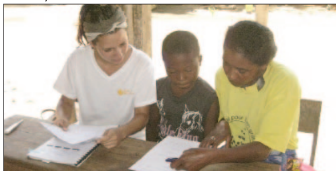
Figura 2. Realización de encuestas en el Centro Nutricional de Amboriky.